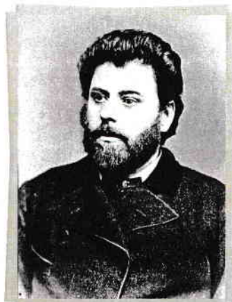
Ion Creangă (1837 - 1889)

3 Descrie oral, în fața clasei, satul lui Nică, oferind informațiile descoperite în textul audiat. Acordă atenție gesturilor, expresiei faciale și poziției corporale.